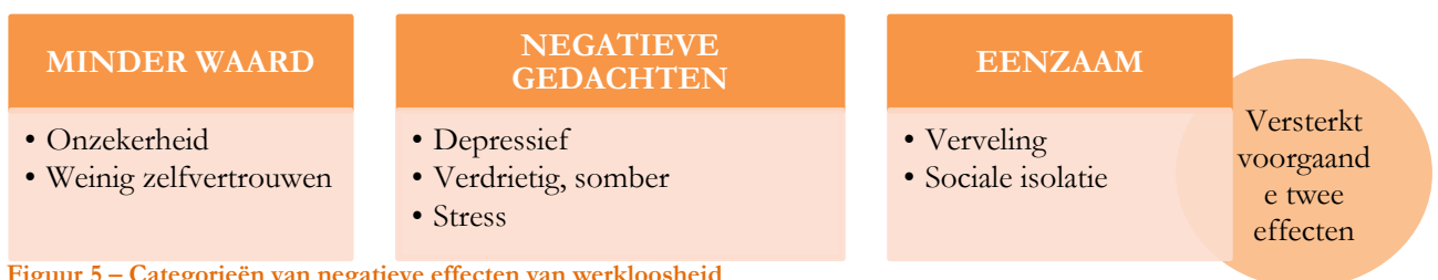
Figuur 5 – Categorieën van negatieve effecten van werkloosheid

De uitkeringsontvangers hebben allemaal een eigen instapniveau in het traject. Aan de hand hiervan wordt bepaald welke activiteiten de uitkeringsontvangers doorlopen. De meest kwetsbare groep heeft een groter deel scholing. Hierbij is te denken aan uitkeringsontvangers die de Nederlandse taal nauwelijks beheersen, niet overweg kunnen met de computer en ziektekwalen hebben als diabetes. De uitkeringsontvangers die niet langdurig werkloos zijn en de Nederlandse taal beheersen, doorlopen minder scholingstrajecten maar voeren met name maatschappelijk nuttig werk uit waarin het draait om doen. Het instapniveau wordt bepaald door de duur van de werkloosheid, het werkverleden, de thuissituatie en de negatieve effecten van werkloosheid. Deze negatieve effecten van werkloosheid zijn onder te verdelen in drie categorieën. De meeste uitkeringsontvangers hebben last van de middelste categorie: sombere gedachten. Doordat ze de hele dag thuis zitten denken ze veel aan hun zorgen en problemen. De verveling en het sociale isolement waarin velen zich bevinden zorgt voor een versterking van deze psychische negatieve effecten. Een deel van de respondenten geeft tevens aan zich minder waard te voelen en een verlaagd zelfbeeld te hebben. De meest kwetsbare groep voor deze negatieve effecten op zowel psychisch als sociaal gebied zijn de alleenstaande of alleenwonende Turkse en Marokkaanse vrouwen.