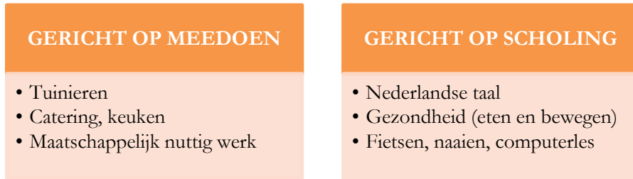
Figuur 4 – Aard van geleid vrijwilligerswerk

De aard van het geleid vrijwilligerswerk bestaat uit diverse werkzaamheden welke allemaal in groepsvorm worden gedaan door de uitkeringsontvangers. De activiteiten die de uitkeringsontvangers uitvoeren binnen het traject zijn te delen in twee categorieën: activiteiten: