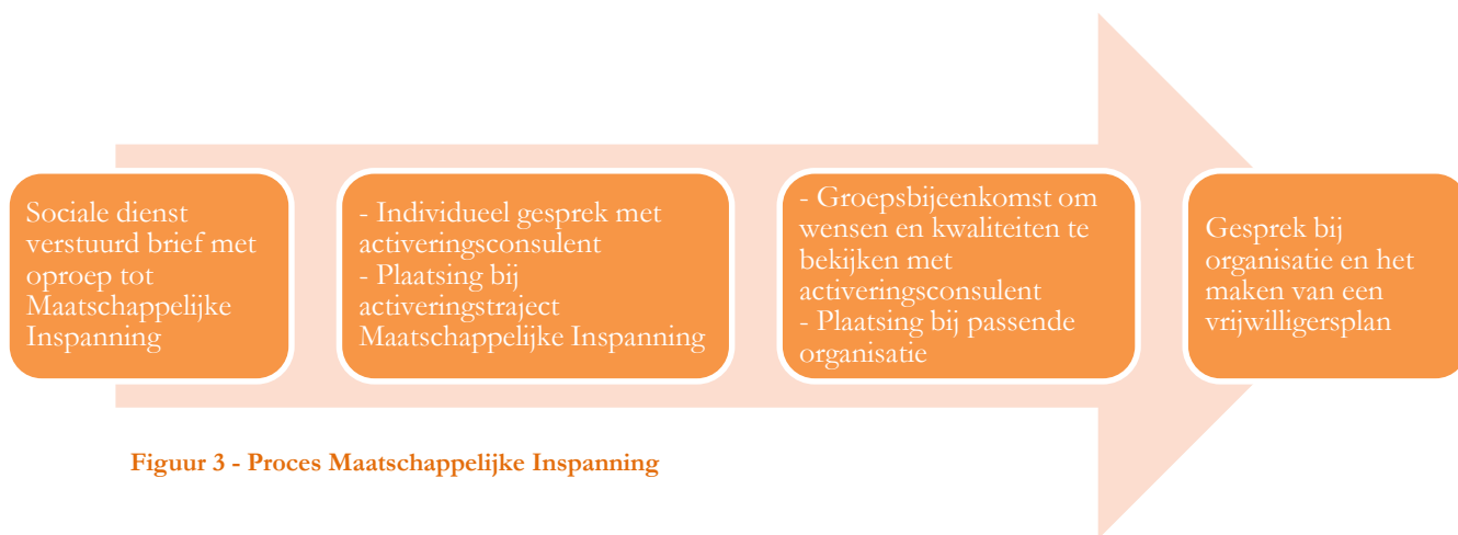
Figuur 3 - Proces Maatschappelijke Inspanning

Er wordt hard gestraft op het niet komen opdagen op deze gesprekken: niet komen opdagen betekent een aangetekende aankondiging. Bij een reactie wordt een gesprek gevoerd, indien er niet wordt gereageerd wordt een maatregel opgelegd waaronder het halveren of stopzetten van de uitkering (Draoui, van Dijk & Burger, 2013).