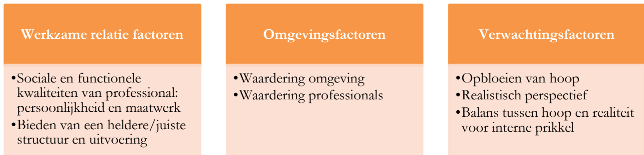
Figuur 7 - Condities voor positieve uitkomsten

Deze deelvraag geeft inzicht in de vruchtbare aarde waarin het traject in de wijk Bloemhof zich heeft kunnen slagen. De condities die positieve uitkomsten bevorderen bestaan uit: